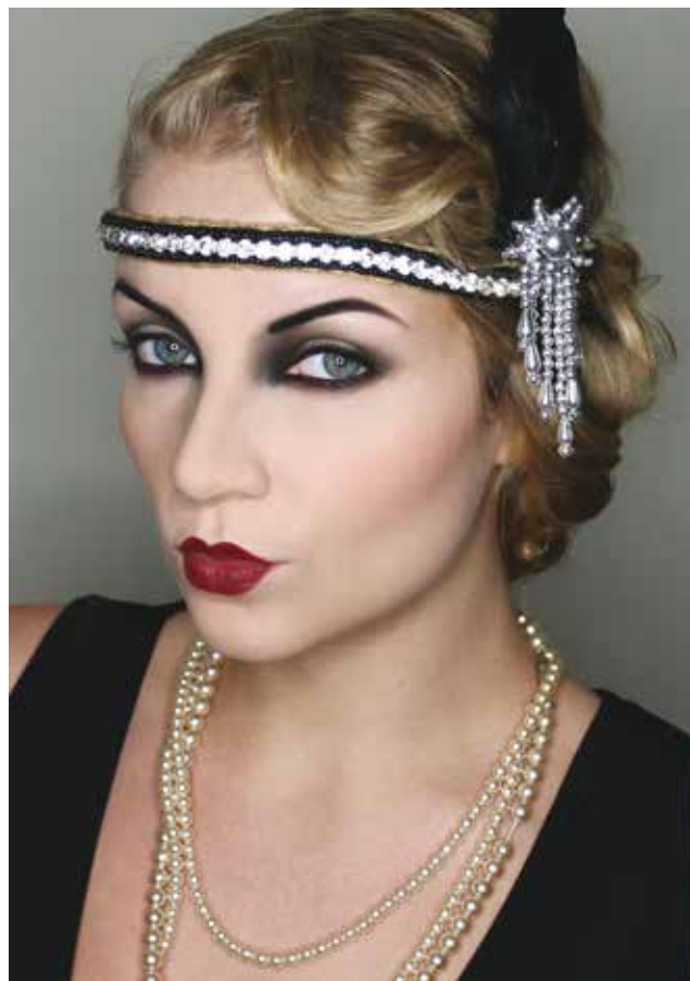
Fot. 2 Współczesny makijaż stylizowany na lata 20.