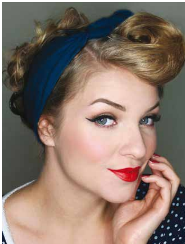
Fot. 5 Współczesny makijaż stylizowany na lata 50.