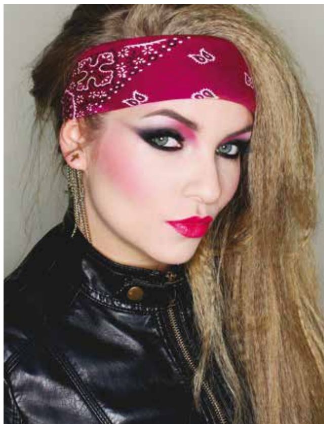
Fot. 8 Współczesny makijaż stylizowany na lata 80.