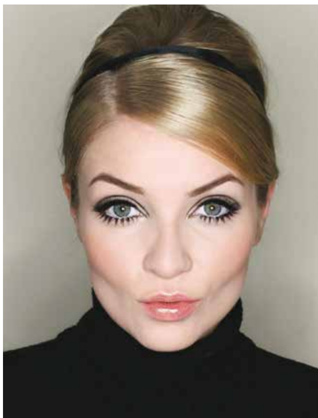
Fot. 6 Współczesny makijaż stylizowany na lata 60.