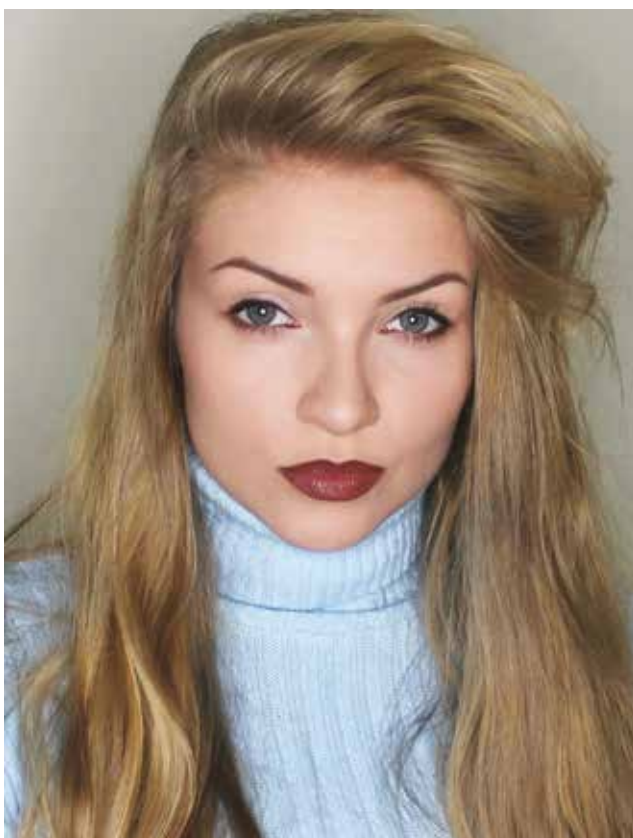
Fot. 9 Współczesny makijaż stylizowany na lata 90.