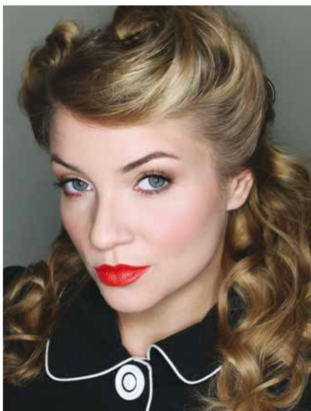
Fot. 4 Współczesny makijaż stylizowany na lata 40.