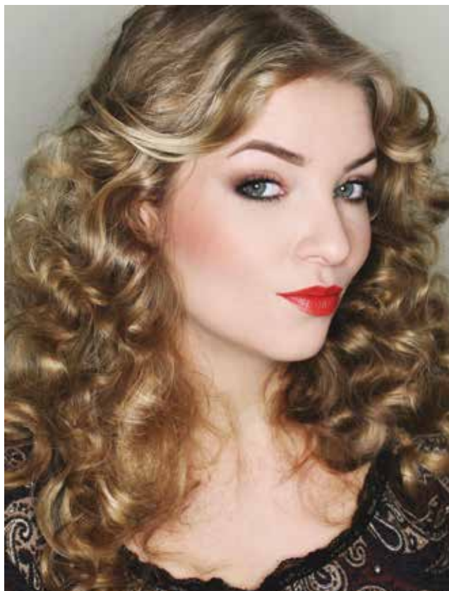
Fot. 7 Współczesny makijaż stylizowany na lata 70.