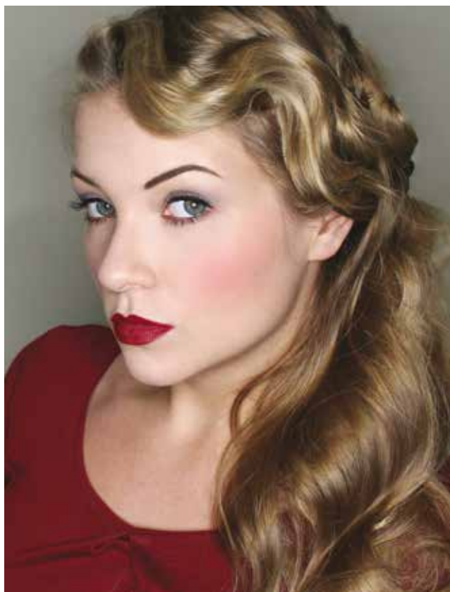
Fot. 3 Współczesny makijaż stylizowany na lata 30.