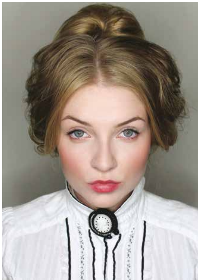
Fot. 1 Współczesny makijaż stylizowany na lata 1911-1920