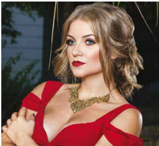
Fot. 11 Wieczorowy makijaż współczesny Źródło: [1]