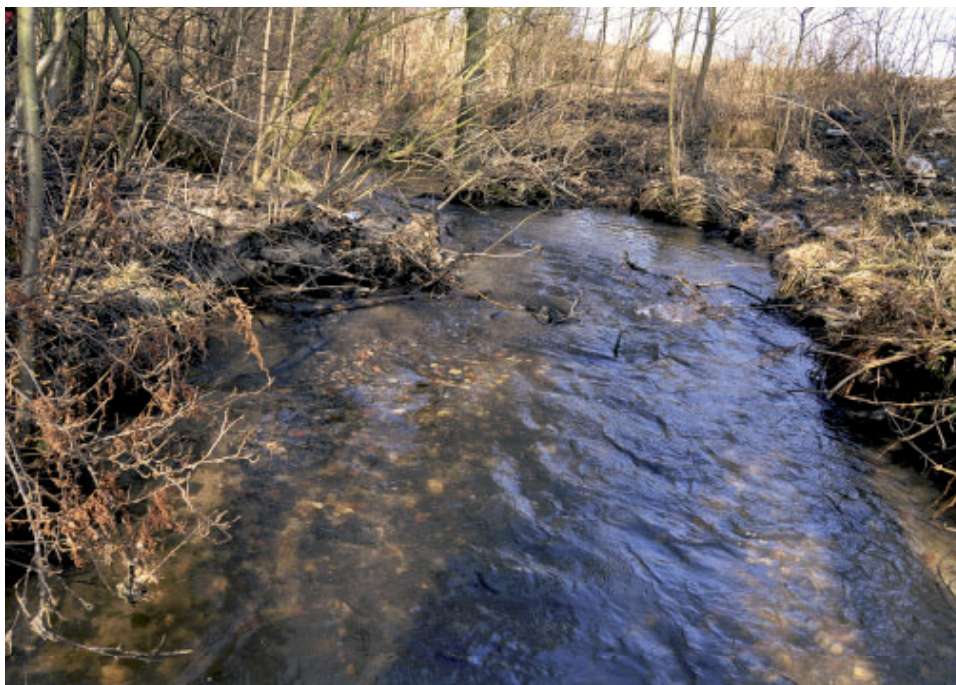
Fot. 4. Strumień w systemie rzeczonym Bzury – podłoże kamienisto-żwirowe, potencjalne tarlisko minoga strumieniowego.