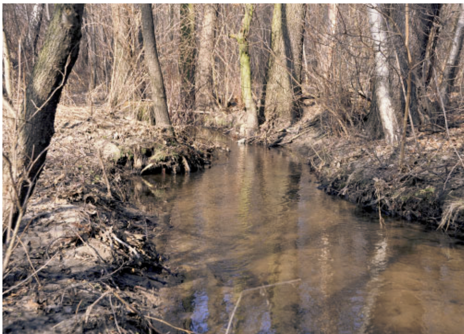
Fot. 3. Strumień w systemie rzeczonym Bzury – przykład siedliska z licznie występującym minogiem strumieniowym. Podłoże piaszczysto-żwirowe odpowiednie dla bytowania larw.