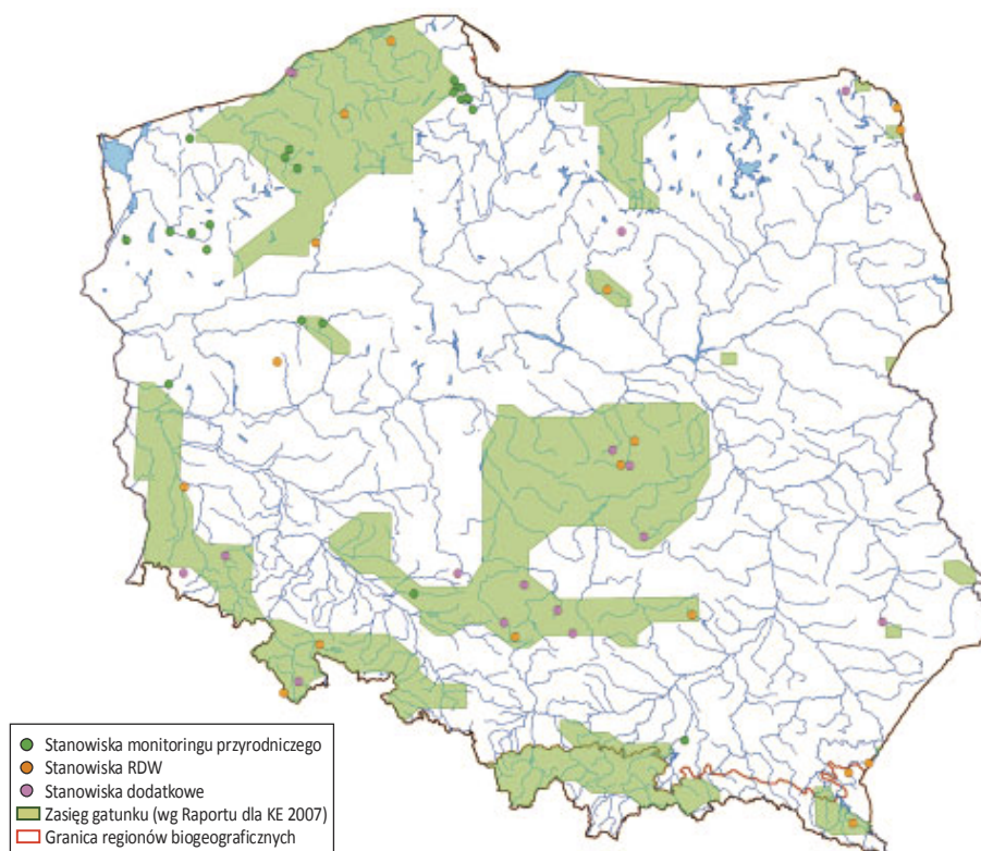
Ryc. 1. Proponowane stanowiska monitoringu minoga strumieniowego na tle krajowego zasięgu gatunku.

Minóg strumieniowy jest gatunkiem, którego zasięg występowania obejmuje systemy rzeczne zlewiska Bałtyku i Morza Północnego oraz rzeki atlantyckich wybrzeży Francji, Wielkiej Brytanii i Irlandii. W basenie Morza Śródziemnego zamieszkuje nieliczne rzeki wybrzeży Francji i zachodnich Włoch. Izolowane populacje stwierdzono w Portugalii (rzeki Sado, Tagus, Douro), a także w górnej Wołdze, górnym dorzeczu Dunaju i niektórych jego dopływach (rzeki Cisa, Morawa, Drawa, Hornad) oraz w systemie rzeczonym Pescary na adriatyckim wybrzeżu Włoch (Hardisty 1986, Witkowski 2000). W Polsce gatunek ten występuje na terenie całego kraju, w systemach rzecznych Odry, Wisły, Niemna i Łaby oraz w rzekach przymorskich (Penczak i in. 1998, Witkowski, Kotusz 1997a, 1997b, Witkowski 2000, Witkowski i in. 2000, Marszał 2001, Dębowski i in. 2002, 2004, Zięba 2006; Ryc. 1), aczkolwiek jest wyraźnie mniej liczny we wschodniej części dorzecza Wisły z wyjątkiem jego górnego fragmentu. Stanowiska minoga strumieniowego