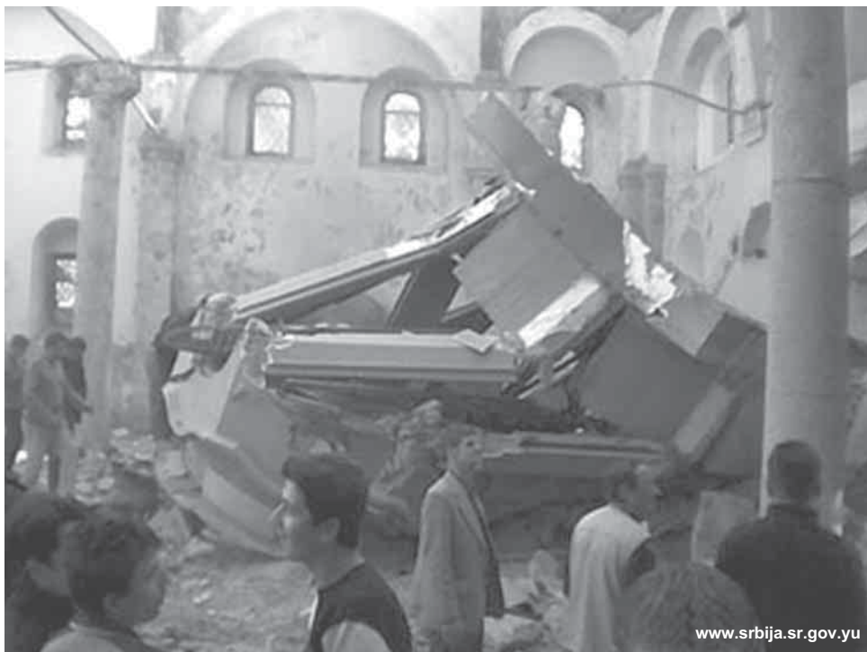
Разбураная царква ў Прызрэне

Трагедыя Югаславіі пачалася тады, калі ўлады аб’яднанай Нямеччыны вырашылі аднавіць свае зоны ўплываў на Балканах. Такім працэсам зацікаўлены былі таксама Аўстрыя і Італія. Харвацкія і славенскія сепаратысты атрымалі сродкі на прапаганду, замежныя кантакты ды ўсебаковую падтрымку нямецкай дыпламатыі і разведкі. Рэспублікі, у якіх з цэнтральнага бюджэту праведзены былі найбольшыя інвестыцыі і якія мелі працаваць для пярэб усяе Югаславіі, аб’явілі сецэсію,