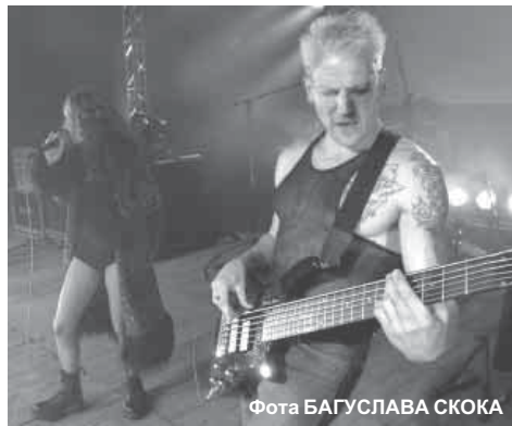
Гурт Індыга на „Басовішчы 2004”

Цалкам верагодна, што неўзабаве беларуская мова загучыць на еўрапейскіх танц-пляцоўках ды ў элек-