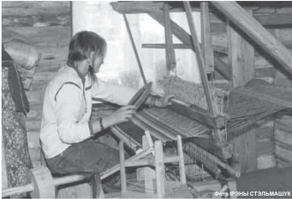
Іаанна Стэльмашук за кроснамі сваёй бабулі

Імкнешся Ты абавязкова Вывучыць чатыры мовы. Жадаю, каб Твая Сямёрка Была шчаслівай на шасцёркі.