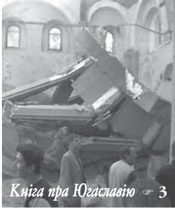
Кніга пра Югаславію 3