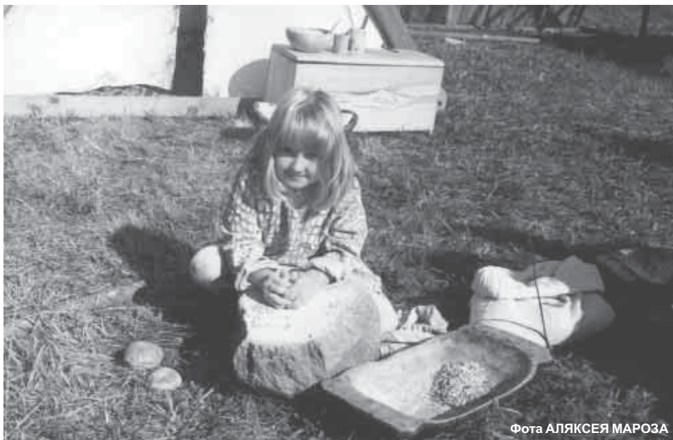
Фота АЛЯКСЕЯ МАРОЗА

Сабраныя цікавіліся жыццём у сярэдневякоўі (каля палаткі)