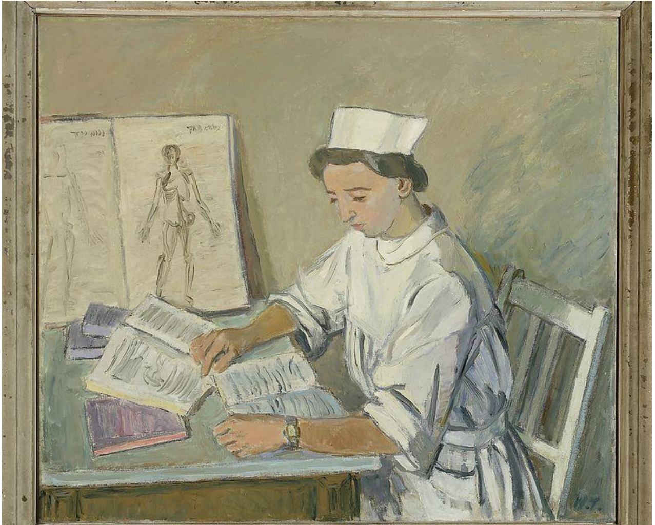
Wacław Taranczewski, Przed egzaminem , ok. roku 1951